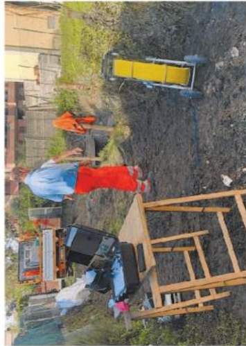
Canali Battagli | lavori che si sono svolti nel sifone Giglio sul canale Battagli

ti interessati alla gestione del canale ed è stato eseguito un accurato check-up dei tratti tombati, che si alternano ai tratti a cielo aperto, nello sviluppo dell'infrastruttura, preziosa per assicurare la fornitura dell'acqua a decine di utenze in passato solo agricole, oggi anche domestiche, commerciali e industriali, e per alleggerire il sistema di drenaggio urbano, ottimizzando la risposta del reticolo al rischio idraulico in caso di copiose precipitazioni. Ad essere sottoposti a "visita specialistica" sono stati in particolare due manufatti, sui quali da tempo si addensavano timori sul loro stato e risultava necessaria una verifica in tema.