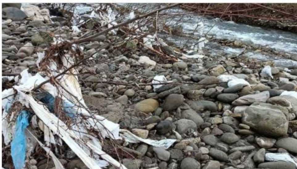
Plastica lungo l'Arno

Consorzio di Bonifica 2 Alto Valdarno, comuni, Sei Toscana, associazioni e mondo del volontariato insieme per soccorrere il fiume e liberarlo dalle plastiche che ne rendono irriconoscibile il volto e rischiano di comprometterne l'equilibrio, biologico e idraulico