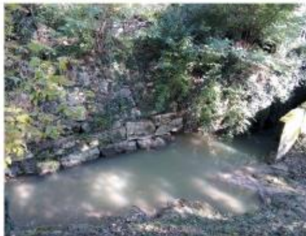
Borro al Quercio. Progetto di sistemare gli argini per evitare danni durante le piene

“Il manufatto di immissione, in corrispondenza del punto in cui il Fosso Reale drena le acque da tutta la zona valliva circostante, non riesce più a svolgere