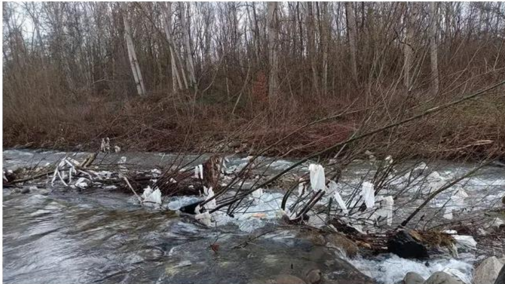
Arno invaso dalla plastica

Consorzio di Bonifica 2 Alto Valdarno, comuni, Sei Toscana, associazioni e mondo del volontariato insieme per soccorrere il fiume e liberarlo dalle plastiche