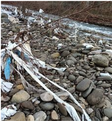
La situazione attuale dell'Arno

Eco giornata con protagonisti i cittadini su 4 chilometri di asta fluviale "sporcati" dalle ultime piene