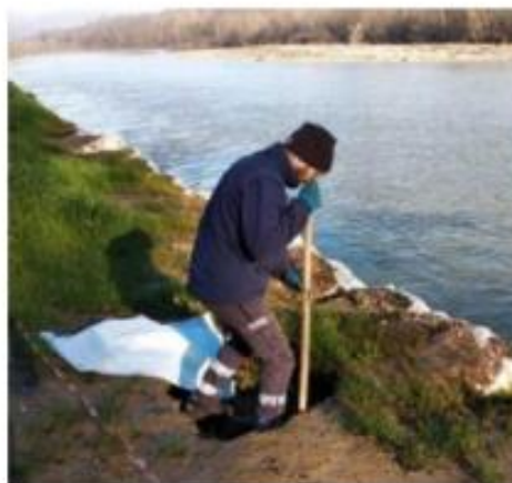
Interventi lungo l'Arno per evitare rischi idraulici

I risultati. In tre anni, non sono stati pochi. All'intervento principale sull'Arno, con la realizzazione della massicciata spondale nel tratto compreso tra Ponte Ipazia e Ponte Pertini, sono seguiti l'intervento di contenimento della frana spondale nel tratto di fiume davanti allo stadio, la progettazione per un intervento analogo tra il Ponte Ipazia e la Ivv, i contributi per la progettazione su borro al Quercio, i finanziamenti della Protezione Civile Regionale per i lavori che vedono sempre il Consorzio di