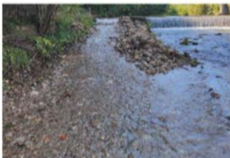
La risalita delle trote. Ripartito l'ascensore del fiume Tevere grazie al patto sottoscritto dal Consorzio di Bonifica 2 Alto Valdarno con la Regione Toscana.

versare per l'esecuzione degli interventi sui corsi d'acqua. In un tesoretto da investire nella manutenzione dell'opera e della relativa cura di risalita.