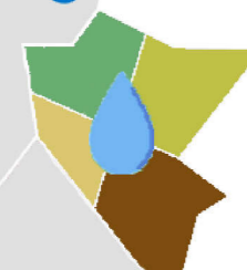
Tavola 03.c Oggetto Distretto 7 Scala 1:10.000 Versione 2.0 distanza delle particelle - sottindice Ic1