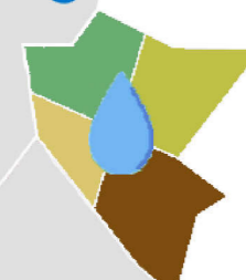
Tavola 05.c Oggetto Distretto 7 Scala Indice di servizio (Is) Versione 2.0