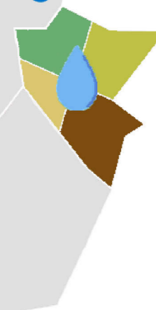
Tavola 06.d Oggetto Distretto 42-43 Scala Indice pedologico (Ip) Versione 2.0