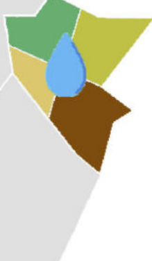
Tavola 02.d Oggetto Distretto 42-43 Scala Perimetro di contribuenza e indicazione delle opere censite funzionali all'esercizio irriguo Versione 2.0